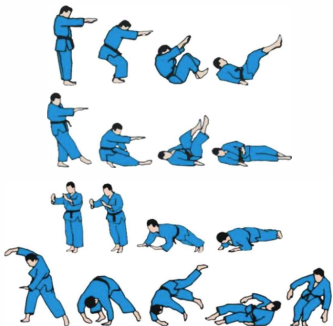
Koho-ukemi (pad w tył)