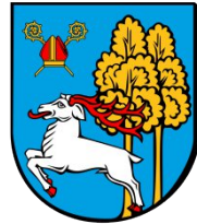
Patronat Prezydenta Miasta Elku